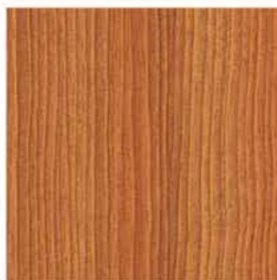
AP 11 PL: degleza IT: douglas FR: douglasie DE: douglasie EN: deglezja