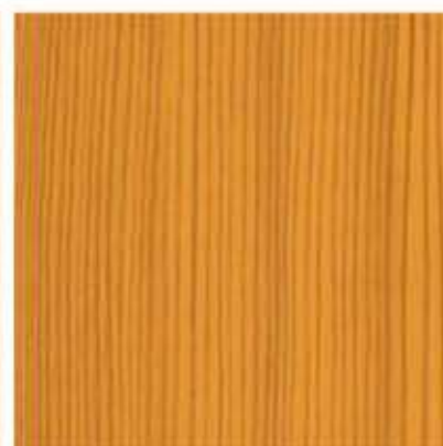
AP 15 PL: oregon III IT: oregon III FR: oregon III DE: oregon III EN: oregon III