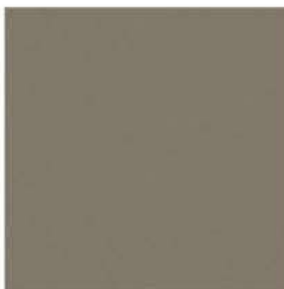
AP 105 PL: trompet IT: trompet FR: trompet DE: trompet EN: trompet