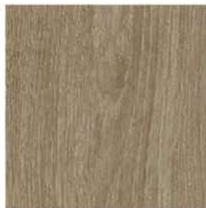
AP 94 PL: dąb Sheffield szary IT: quercia Sheffield grigia FR: chêne Sheffield gris DE: eiche Sheffield grau EN: Sheffield Gray Oak