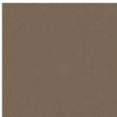
AP 104 PL: czekoladowy brąz IT: marrone cioccolato FR: marron chocolat DE: schokobraun EN: chocolate brown