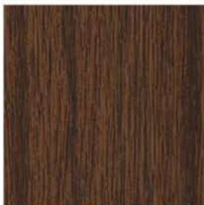
AP 06 PL: ciemny dąb IT: quercia scura FR: chêne moyen DE: mooreiche EN: dark oak