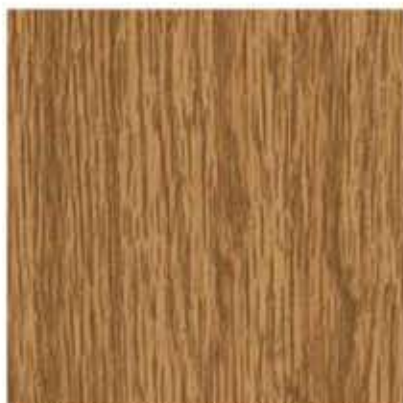
AP 01 PL: dąb specjalny IT: quercia speciale FR: chêne spécial DE: eiche spezial EN: special oak

PLEASE NOTE: The presented colours are for illustrative purposes only and may significantly differ from the actual window colour.