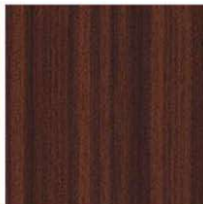
AP 05 PL: mahoń IT: mogano FR: acajou DE: mahagoni EN: mahogany