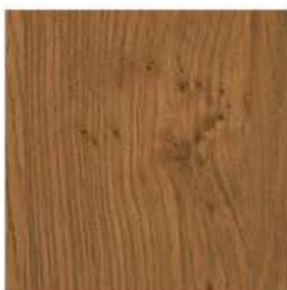
AP 95 PL: winchester IT: winchester FR: winchester DE: winchester EN: winchester