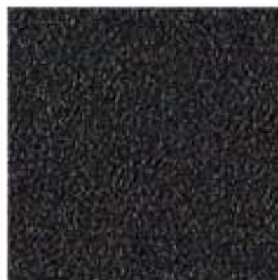
AP 106 PL: jet black mat IT: jet black mat FR: jet black mat DE: jet black mat EN: jet black mat