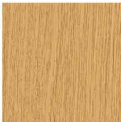
AP 02 PL: dąb naturalny IT: quercia naturale FR: chêne naturel DE: eiche natur EN: natural oak