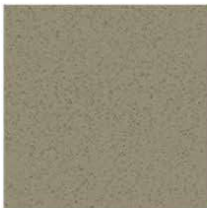
AP 107 silver alux